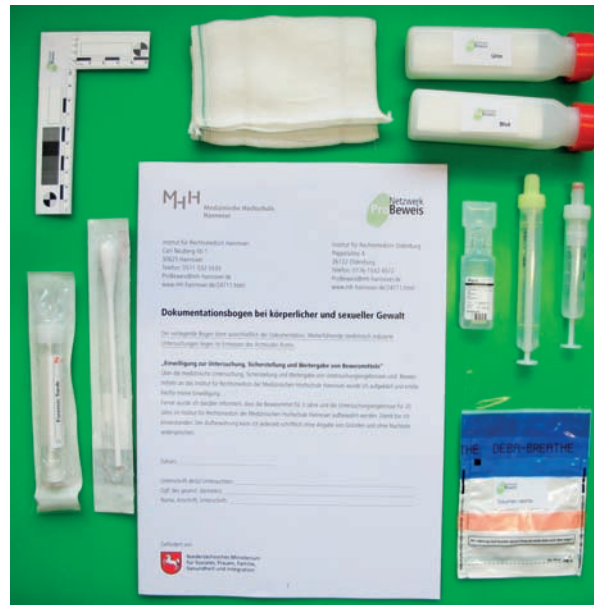
In allen Untersuchungsstellen werden standardisierte Dokumentationsbögen und spezielle Spurensicherungssets verwendet

Wenn Sie Verletzungen haben, die einer medizinischen Behandlung bedürfen, suchen Sie sofort ärztliche Hilfe auf!